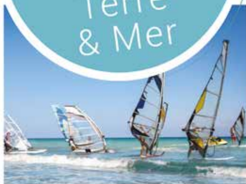
Les sports nautiques / Water sports

Between land and sea, the Eden Camping Site welcomes you on 5 hectares green parkland, located at a distance as the crow flies 2.5 km far from one of the most beautiful European beach. We are also at 800 m far from the first shopping facilities.