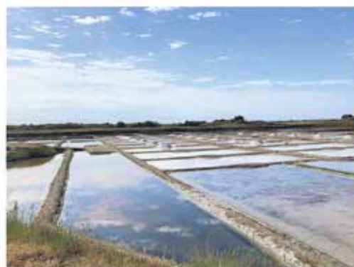
Les marais salants de Guérande The salt marshes of Guérande