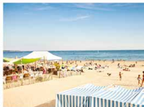
La plage / The beach