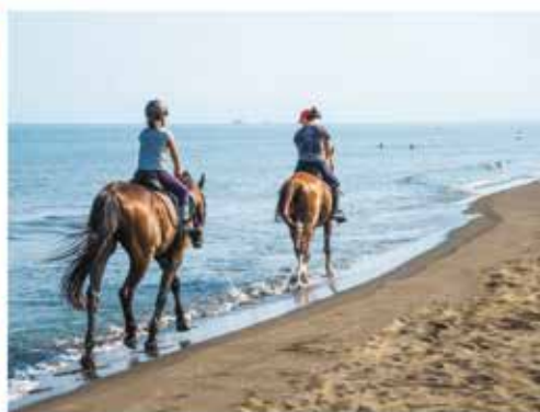
Équitation / Horse riding