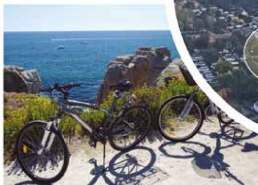
Les côtes sauvages / The wild coast