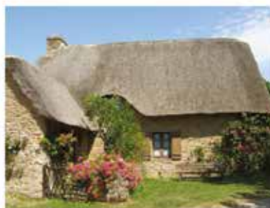
Village de Kerhinet